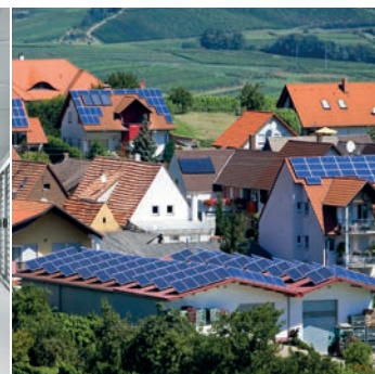
Comunidad Energética Local LEC