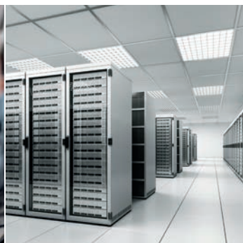
Industria y centro de datos