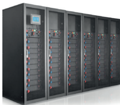
Armario de baterías de litio de Riello