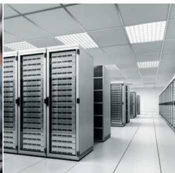
Industria y centro de datos