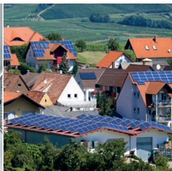
Comunidad Energética Local LEC